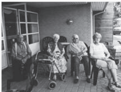
Bylivet iagttages fra Æblehavens terrasse.

Helt fra starten har det været hensigten, at Æblehaven ud over at være et bosted også skulle være et mødested for ældre i Næsbjerg. Både pensionistforeningen og Æblehavens Venner inviterer til forskellige arrangementer, og der er en god mødeaktivitet, hvilket betyder, at mange af byens beboere kommer i huset til et foredrag, en sangeftermiddag, en fest eller måske til et spil kort om onsdagen. Hvert år laver vennekredsen udflugter for beboerne, som gerne vil deltage i ture ud af huset, og vi har været mange steder. I 2009 er der på programmet en tur til Miniby og Arnbjerg og en længere tur til Fanø. Det plejer at være nogle hyggelige ture, hvor vi ud over at komme ud at køre i en dejlig natur også får lidt godt at spise. Festerne i Æblehaven skal også nævnes, fordi der altid er en rigtig god stemning, hvad enten det drejer sig om grillfest, høstfest eller julefrokost. Her er det igen delta-